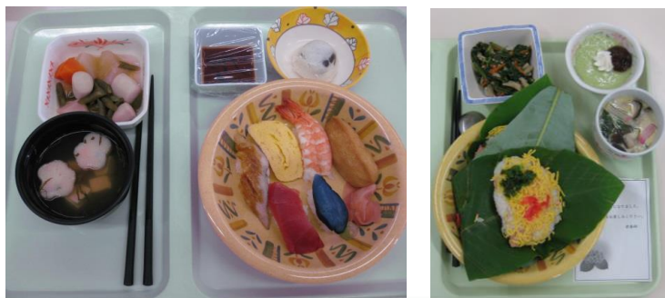
お楽しみ献立「2月立春(左)」と「6月ほう葉寿司(右)」

また、衛生面や温度管理に細心の注意を払い、患者さまに喜んでいただけるよう、安心して安全かつ美味しい病院給食を提供できるよう、日々検討を重ねています。