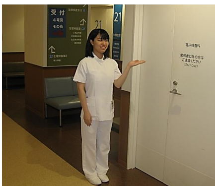
臨床検査室の一角に細菌検査室があります。 ※検査室は関係者以外立ち入り禁止です

みなさんは細菌検査室と聞くと、どのようなイメージがありますか？ 細菌検査室では肺炎等の感染症で病気の原因となっている細菌を探りあてる業務を行っており、感染症の診断や治療において非常に重要な役割を果たしています。