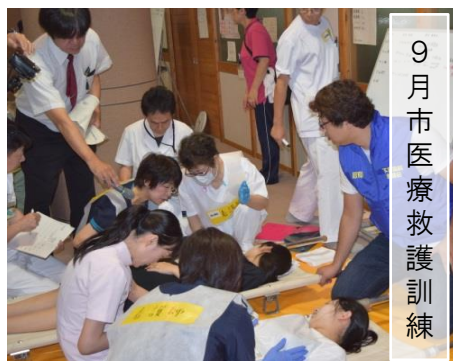
9月市医療救護訓練