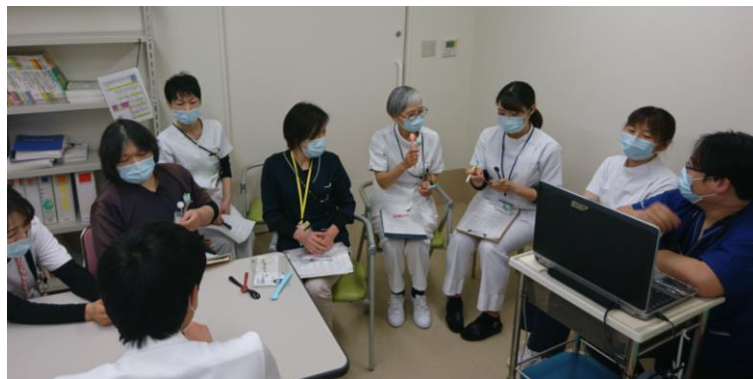
スタッフ会議の様子

今後も続く高齢社会の中で、「口から食べる」という機能を取り戻して、健康で自分らしい生活を送れるようスタッフ一同支援していきます。