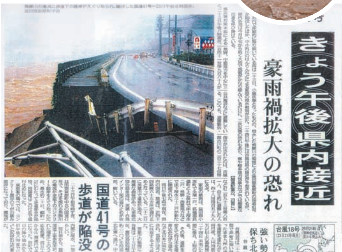
新聞写真撮影地区：中呂地区国道41号 円内写真撮影地区：中呂地区

この豪雨により、家屋全半壊3戸、床上床下浸水75戸などの被害があり、72世帯281人が避難しました。