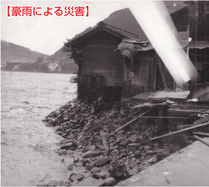
撮影地区：森地区 温泉街

この豪雨により、死傷者5人、家屋全半壊74戸、床上床下浸水276戸、その他道路決壊、橋梁流出などの被害が続出しました。