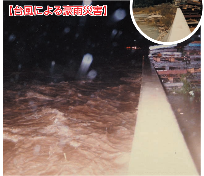
撮影地区：古関地区

台風10号の影響で降り始めた雨は27日0時より21時までの連続雨量で218mmを記録しました。この豪雨により、負傷者1人、床上床下浸水208戸などの被害がありました。